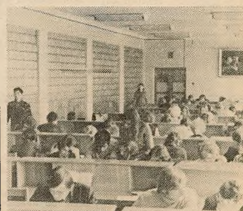
У чытальнай зале.